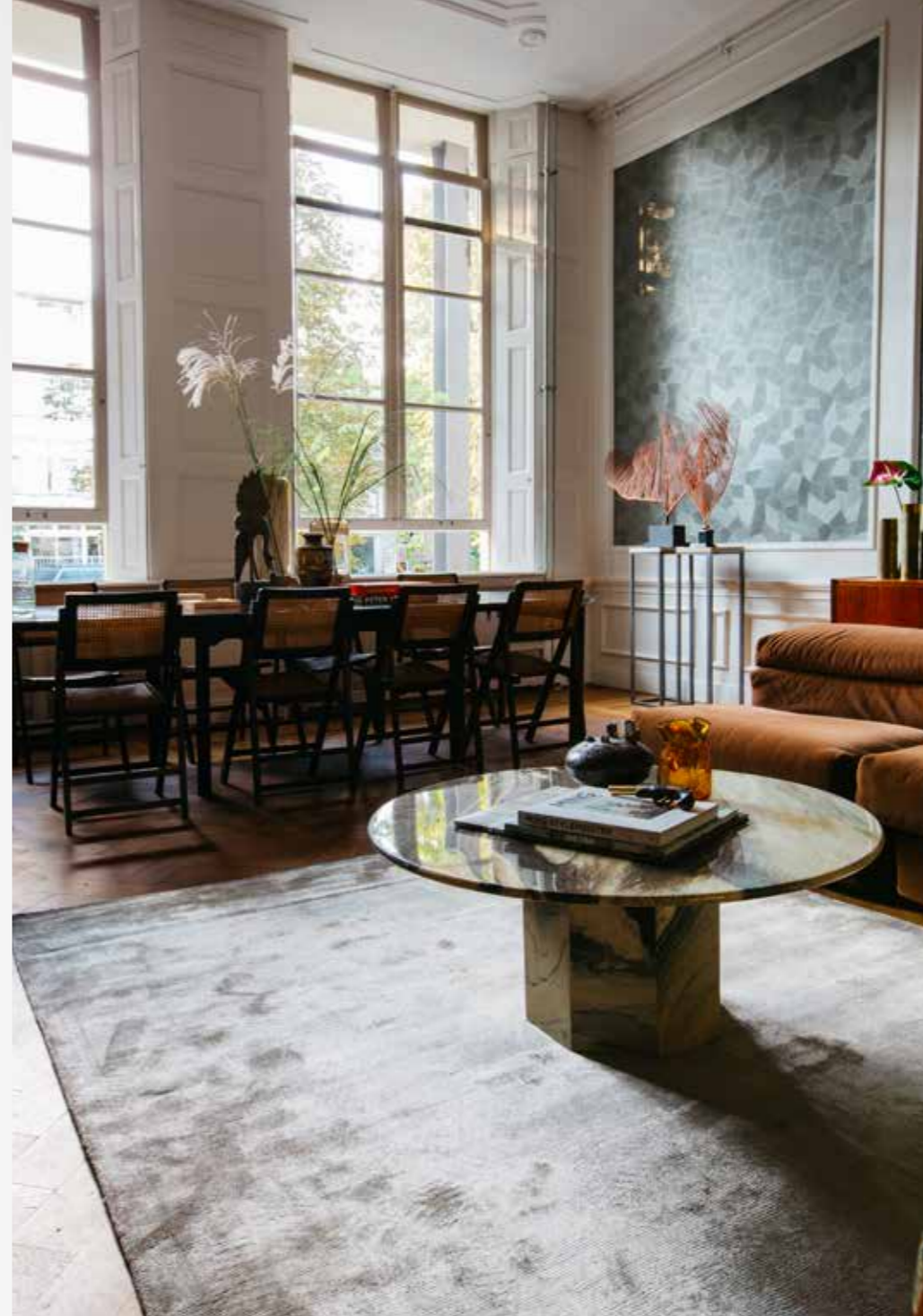
This room is decorated as a living room, with a velvet sofa and beautiful wallpaper that captures the light with magical effects.

Listening is the most important part of our work. But we also try to show people new ideas.