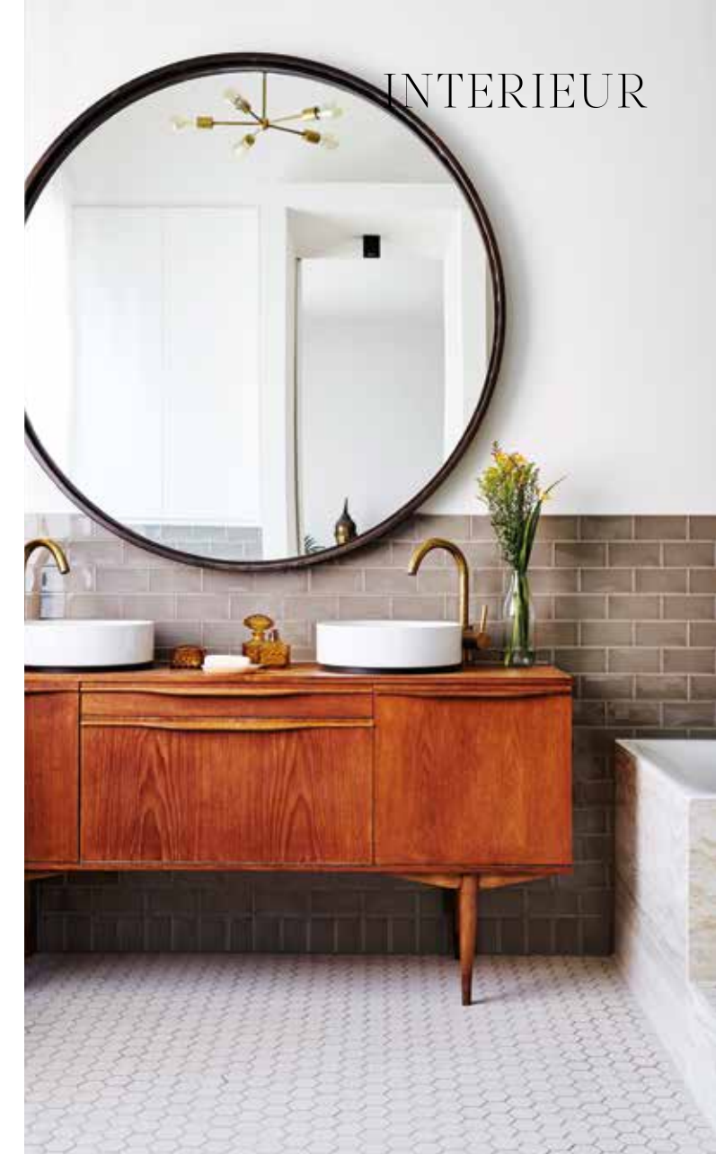
Vloertegels van Winckelmans, de spiegel is een ontwerp van Nicemakers, vintage kabinet in Deense stijl, plafond lamp via etsy.com, wasbakken van Alape, kranen van Tapwell, muurtiegels van Cotoceramix. Onder: Detail van de vloertegels van Winckelmans.