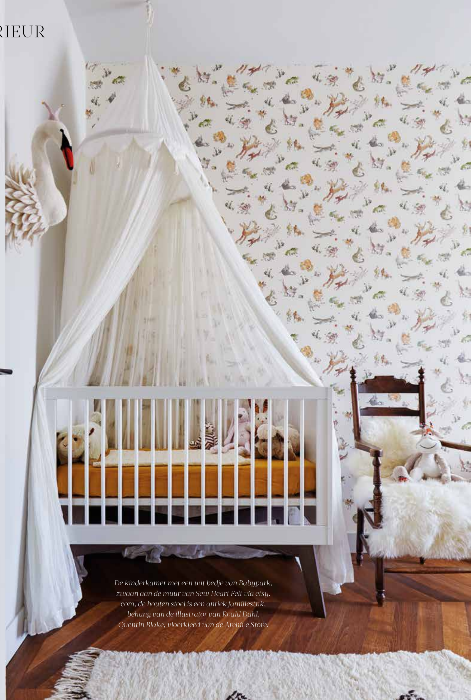
De kinderkamer met een wit bedje van Babypark, zwaan aan de muur van Sew Heart Felt via etsy.com, de houten stoel is een antiek familiestuk, behang van de illustrator van Roald Dahl, Quentin Blake, vloerkleed van de Archive Store.